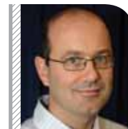
FEDERICO STURZENEGGER Ph.D. in Economics, Massachusetts Institute of Technology. Presidente, Banco Ciudad de Buenos Aires. Profesor, UTDT.