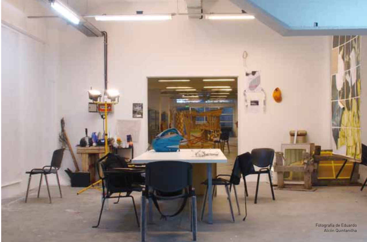
Fotografía de Eduardo Alcón Quintanilha