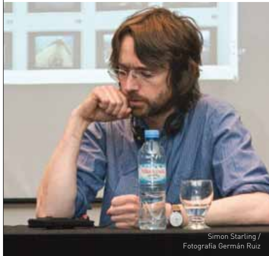
Simon Starling